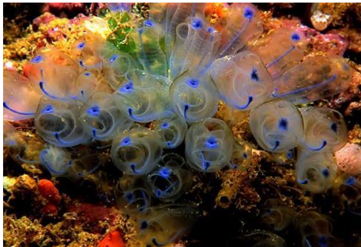
चित्र 2: ट्यूनिकेट (समुद्रीजीव)